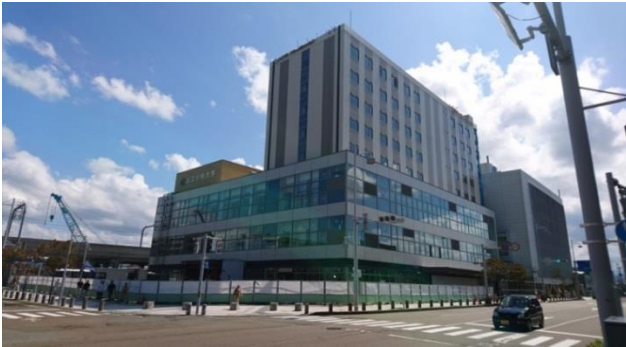
▲「Komatsu A×Z Square(こまつアズスクエア)」外観

また、本施設のグランドオープンが2017年12月1日(金)に決定したことをお知らせ致します。