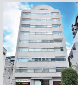
AD神楽坂第一・第二: 日交神楽坂ビル