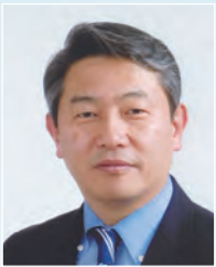
順天堂大学医学部附属順天堂医院 呼吸器外科 主任教授