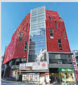
AD赤坂: ヒューリック赤坂一ツ木通りビル

当社は主力コンサルティング商品として、不動産小口化商品「ADVANTAGE CLUB (AD)」を提供しています。多くの方にお申込みいただき、2023年3月に「赤坂」、「6月に「京橋宝町」「神楽坂第一・第二」の任意組合を新規組成いたしました。いずれの物件もオフィスビルやマンションが立ち並び一方、ショッピング、グルメなど様々な目的を持った人が行き交う魅力的なエリアとなっています。ADVANTAGE CLUBでは、お客様の多様なニーズにお応えできるよう、定期的な商品組成を展開してまいります。