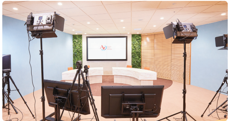
照明、モニター、カメラ等の撮影機材も本格仕様