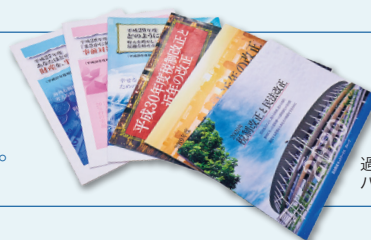
過去の税制改正 パンフレット