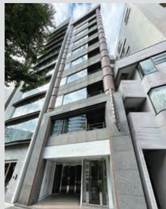
ADVANTAGE CLUB神田岩本町 トゥルム神田

都心部の不動産を共同で所有し、賃貸収益を受け取る「不動産共同所有システム」です。昨今の不動産運用において、都心部の限られた優良物件以外では安定した賃料収入を得ることは難しくなっています。また、それらの物件は高額で、豊富な「資金」と「経験」、また、購入後の管理・運営にも多くの時間と手間が必要となります。「ADVANTAGE CLUB」はプロが不動産を厳選し、管理・運営を行うことで、こうしたわずらわしさや不安を軽減するシステムです。